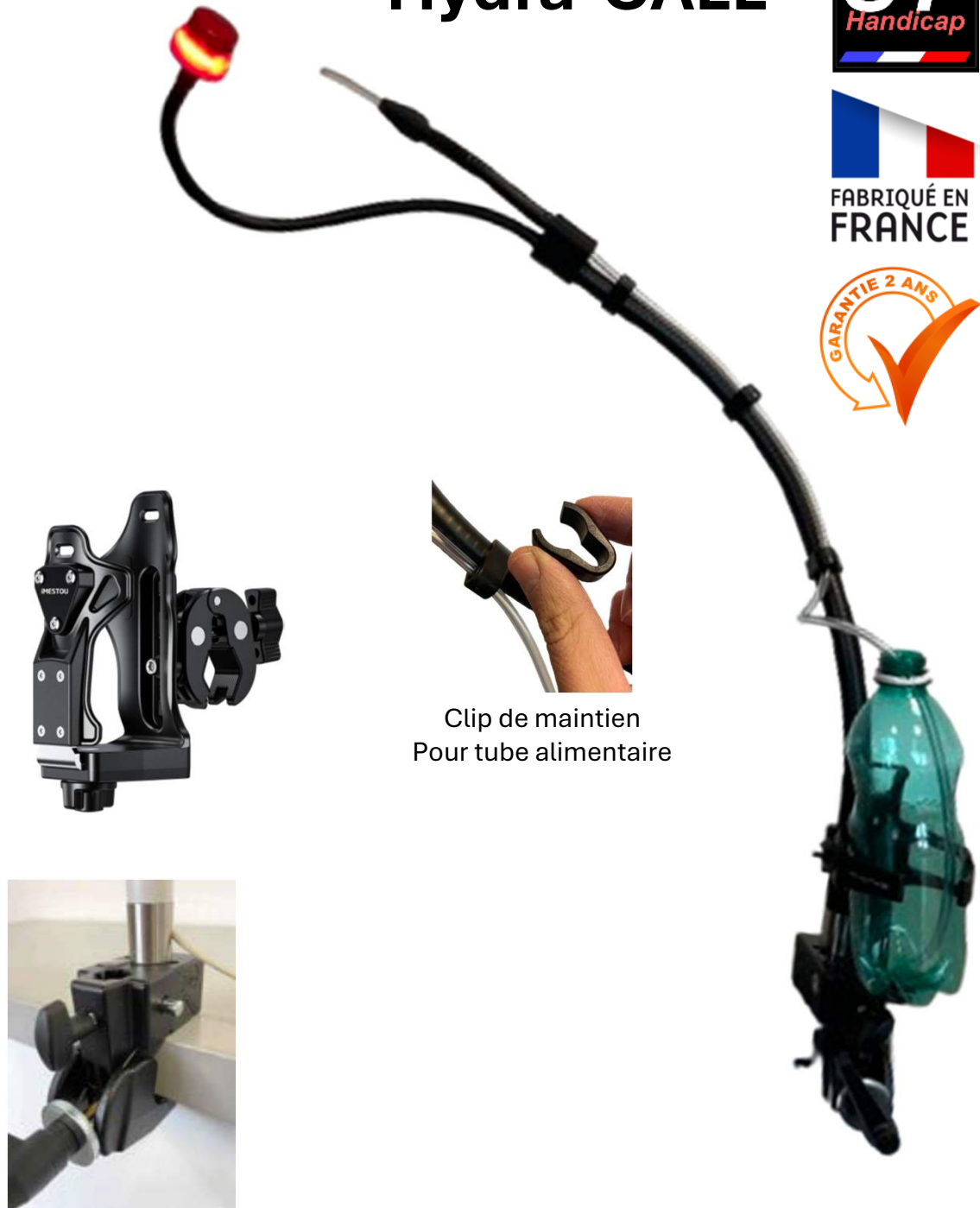
Clip de maintien Pour tube alimentaire