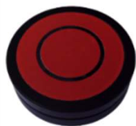
ST-TX6 contacteur bumper 60 mm. .