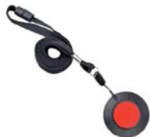
ST27 Médaille pendentif avec sécurité anti-strangulation Alimentation piles Lithium CR2032 / diamètre 41 x 13 mm / Poids 16 gr