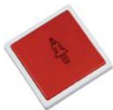
ST-BP-R Emetteur sur piles, 1 fonction, touche à effleurement ou mécanique