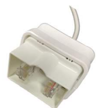
Fiche AE (Double RJ)