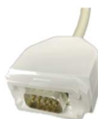
Télévic XT (Db9)