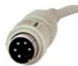
Fiche DIN (7 broches)