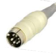
TLV DIN10 pôles