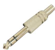
Blick/CRMS (Jack 6,35mm)