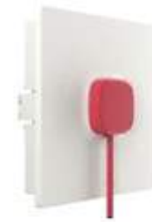
Tirette sanitaire + led anti-arrachement Compatible ascom .