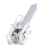
Autres fiches , nous consulter