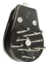
Fiche Hirschmann (6 ou 10 broches)