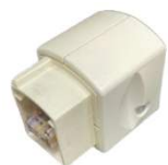
Mini-éjectable (Simple RJ)