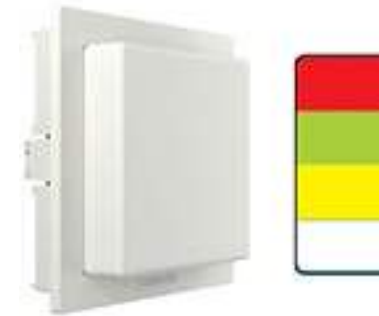
Hublot dalle LED 4 feux Compatible ascom .